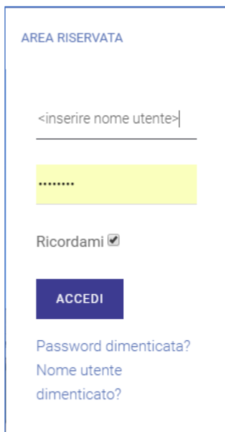
Figura 1 - Maschera di accesso

Una volta collegati al portale, spostarsi con il mouse su "AREA RISERVATA":